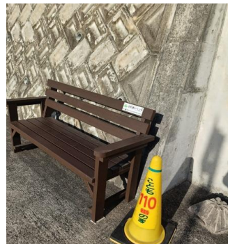
自宅の前に設置しました。一息つく場所、何かあった時に駆け込んでください。

道路や公園、河川など公共施設を美化するボランティア活動のことです。参加される人たちの交流もこの活動の意義の一つです。自分たちのまちは自分たちできれいに。