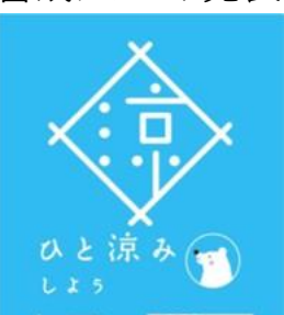
このポスターを目印にしてください