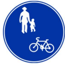
※13歳未満、70歳以上の方、身体障がい者は例外的に歩道走行可能です

自転車は「車両」であり、基本的には車道の左側を通行することになっています。歩道を通ることができるとは、下の標識などで認められている場合です(※例外あり)。なお、その際は歩行者が優先です。周囲の安全に十分配慮しながら走行することが大切です。