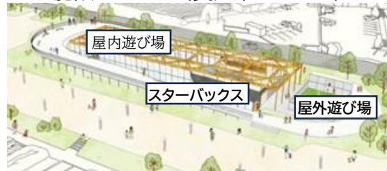
施設イメージ

また、隣接する「いきいきプラザ」内には絵本に親しむことができる施設も並行して整備されます。今後、本市の新たな子育て・交流拠点として、また観光拠点としての役割が注目されます。