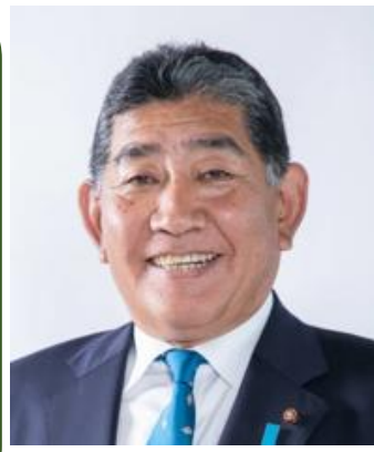
新号発行のご挨拶

本年9月にアジア、アジアパ ラ競技大会が開催されます。ト ップアスリートたちが緑り広げ るであろう熱戦が地元愛知で 行われることを思うとワクワク 感が止まりません。大会が大 いに盛り上がることを期待いた します。ガンバレ、ニッポン!