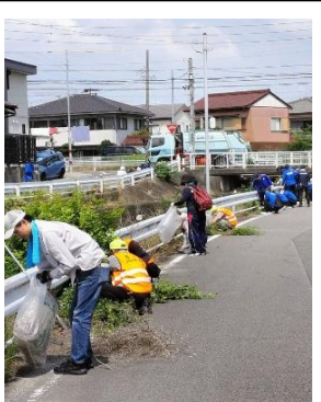
石ヶ瀬自治区では、矢戸川の草刈を6月、9月に行っています。