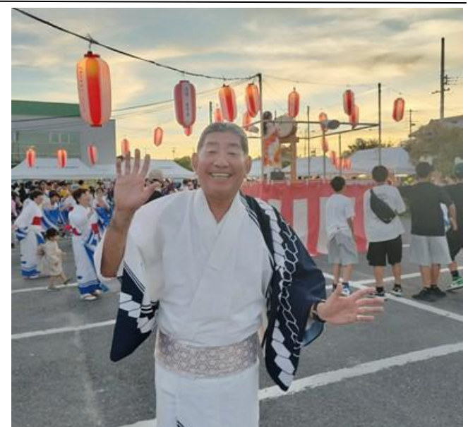
今年も暑さ対策をしながら、地元の夏祭りを大いに盛り上げていきたいと思っています。