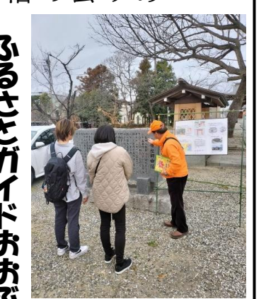
コリアまつり当日 森岡八幡社にてガイド

ふるさとガイドおおぶ 各種イベントでガイド 今年半年間では、大府駅の観光案内所当番をはじめ、七福神めぐり(大日寺)、大府盆梅展での防空壕案内、そしてコリアまつりに絡めた森岡八幡社でのガイドを行いました。これからも大府の歴史文化を学びつつ、皆さんの人に大府の魅力を伝えて行きたいと思っております。