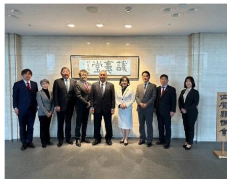
佐賀県庁、「さがデザインについて」