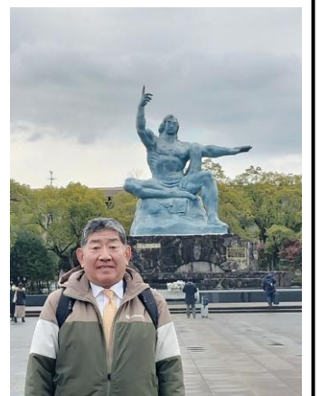
中学生平和大使の派遣先である「長崎平和公園」にも足を運びました。

山口県光市は「コミュニティスクール」の先進地です。コミュニティスクールとは、地域住民が学校運営に参画する仕組みや考え方のことです。こどもを取り巻く環境の多様化に伴う教育現場での課題解決のためには、大府市でも参考となる取り組みだと感じました。