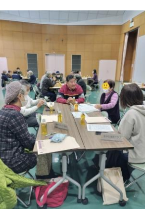
様々な団体の皆さんと情報交換会(石ヶ瀬会館)

大府市社会福祉協議会 ボランティア連絡会 大府市社協にはたくさんの方のボランティア登録団体があります。今回開催された連絡会に「安全環境推進クラブ階」の一員として参加しました。活動発表会では「おおぶ防災ボランティア」、「クリアンスの会」から報告がありました。その後行われた交流会では、様々な志をもつ人たちの熱い思いを聞くことができました。