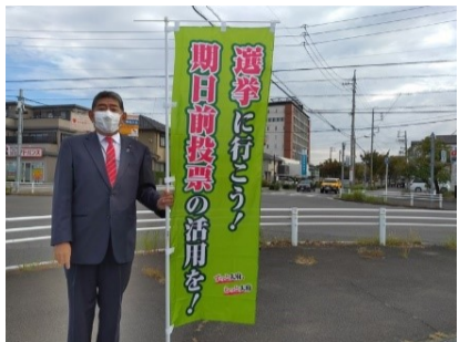
大府駅西交差点にて

10月に行われた衆議院総選挙。立哨で「選挙に行こう!」という幟を作成し、選挙への参加を促しました。大府市の投票率は61.93%(前回比+2.16%、全国比+6%)でした。引き続き立哨活動がんばります。あたらしい時代を皆さんとともに。