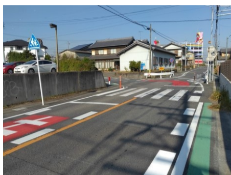
緊急安全対策が施された通学路 令和4年11月撮影 森岡町四丁目、石ヶ瀬住宅付近

令和3年6月に千葉県八街市の通学路で、飲酒運転をしていたトラックが下校中の小学生5人に衝突し、児童2人が死亡、3人が負傷するという痛ましい事故が起りました。この事故を機に、大府市内でも通学路の総点検が行われました。