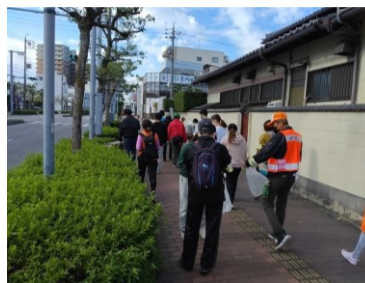
まちピカ☆プロギング

多くの市民の皆さまが参加されることで、意義深いと思われました。こちらは、健康推進員さんが主催する健康ウォーキング。時間の許す限り参加させていたでいて、地域の四季の風景を楽しみながら、地元のお話を伺うなど、とてもいい機会になっています。