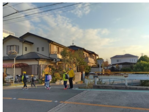
通学児童の見守りを実施中(森岡町)

通学路の危険箇所のご指摘を受け(上の写真)、まず自分の目で現地の状況を確認し、地元森岡自治区、石ヶ瀬小、市役所それぞれに問題の認識と共有を図りました。その結果、即時設置可能な手立てとして、以下の点を整備するに至りました。既設のグリーンベルトに加え、