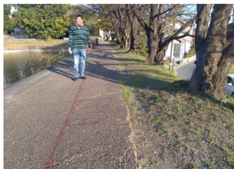
アスファルトの傷み、樹木の根による路面の隆起を補修します。 令和4年3月まで 白紗池周回遊歩道