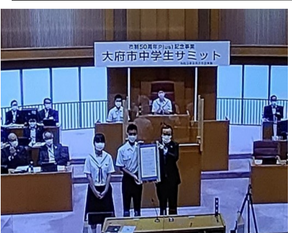
中学生サミット。「中学生サミット共同宣言」を決定して宣言(大府市議会本会議場)

参加された全ての中学生議員の臆さない堂々とした姿勢に、将来を担う本市の若者を大変心強く感じました。