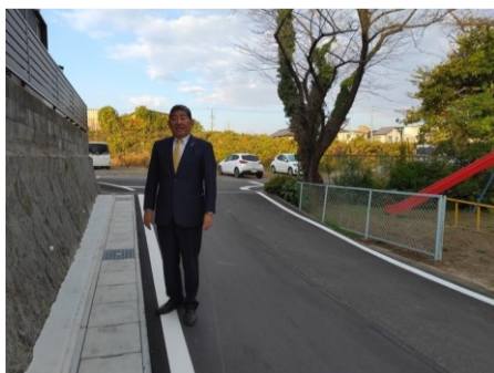
側溝の有蓋化整備 実質的に道路幅も拡張されました 森岡町六丁目地内

長草町の白紗池に隣接する知多半島道路大府下りPAの新設工事(令和4年4月供用開始)に伴い、白紗池を周回する遊歩道の舗装整備が行われます。工事中は利用不可となります。不便をおかけしますが、新しい商業施設と自然豊かな白紗池の親水施設の完成をどうぞお楽しみに。