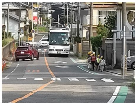
小学生の通学風景 令和4年9月1日撮影 森岡町四丁目、石ヶ瀬住宅付近

令和3年6月に千葉県八街市の通学路で、飲酒運転をしていたトラックが下校中の小学生5人に衝突し、児童2人が死亡、3人が負傷するという痛ましい事故が起りました。この事故を機に、大府市内でも通学路の総点検が行われました。