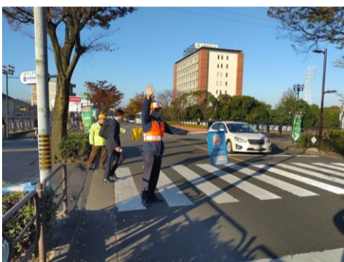
横断者優先運動の活動風景 大府駅西口、豊田自動織機大府工場前

この運動に参加しています。この横断歩道は、通勤で駅に向かう方、大府高校などへ向かう学生・生徒さんがひっきりなしに横断します。ドライバーさんには朝お急ぎのところ、横断歩道での一時停止にご協力をいただけるようになりなりました。「ありがとうございました」とクルマに向かってお礼を言いますと、コクリとあなずく運転手さん。とても気持ちのいい活動です。