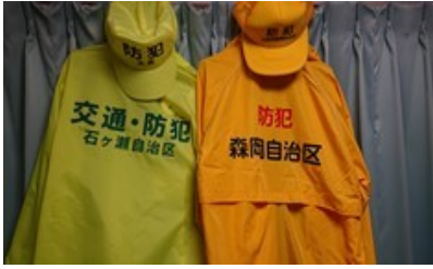
自治区活動用ジャンパー

地域文化活動では、石ヶ瀬地区福祉委員として、石ヶ瀬内のサロンのお手伝い、回覧板用チラシの作成を担当しています。また、森岡自治区独自のホタル保存会の事業は環境保全、住民相互交流といった面で大変貴重な取組と理解しており、積極的