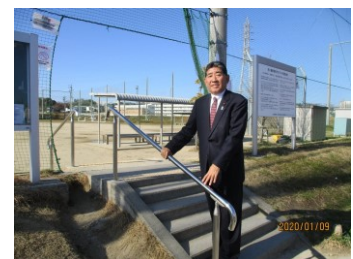
石ヶ瀬多目的グラウンド 入口に設置された手すり (写真②)

大府市内には危険な箇所がまだまだたくさんあります。また「こんなものがあつたら、もっと安全安心なもの」と思われるところもあることと思います。そのような場所を見つけたら、或いはアイデアを思いついたら、是非ともご指摘、ご提案をお願いいたします。例えば、江端町「はりーあつぷ」さんのところの交差点は歩道の待機場所が狭く、大型車の巻込み事故が心配との声を受け、オレンジの樹脂ポール間に鉄柱を設置しました(写真①)。また、森岡の石ヶ瀬多目的グラウンドの入口階段に、高齢者向けの手すりが欲しいという声を受け、早速設置してもらいました(写真②)。皆さまの声は確実に担当部署にお伝えし、解決策を探ります。