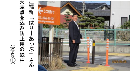
江端町「はりーあつぷ」さん 交差点巻込み防止用の鉄柱 (写真①)

昨年末で三十二回を数えました。気持ちよく一日のスタートが切れますように、明るい挨拶を心がけています。通勤、通学、ウォーキング、散歩の途中に見かけましたら、声をおかけ下さい。