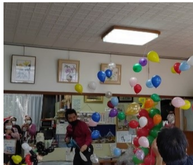
全世代型サロン「みどり」 江端町みどり集会所 毎月第三土曜日11時から

全世代型サロンとは、小さい子どもたちから高齢者まで皆さんと一緒にランチを食べながら憩える居場所のことで、そんなサロンが地元につ開設しました。 その一つは「みどり」。NPO法人はっぴーわんさんが主催していて、とても家族的な雰囲気。バレーンショー、紙芝居、カードゲームなど毎月いろいろなゲストが登場し、参加者皆さんで楽しめます。二つ目は「だんらん」。こちらはNPO法人ネットワーク