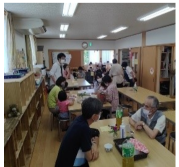
全世代型サロン「だんらん」 ネットワーク大府キッズ棟 毎月第一土曜日11時から