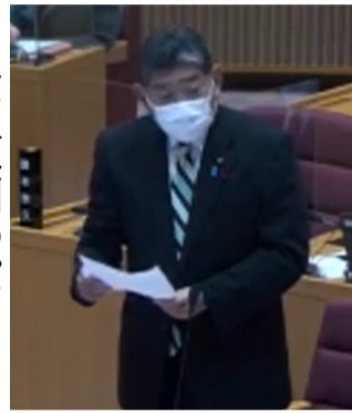
学校図書館の機能強化について再質問する(本会議場、質問席にて)

このほど文部科学省より、令和4年度から令和8年度までの期間を対象とした「第6次『学校図書館図書整備等5か年計画』」が示されました。