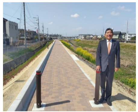
本年3月に供用開始した森岡橋南、石ヶ瀬川右岸緑道

石ヶ瀬川緑道の整備 石ヶ瀬、森岡地区のウォーキング環境がどんどん良くなっています。石ヶ瀬川沿い、森岡橋から南に向かった右岸の緑道が完成しました。緑道の先には、以前からあった川底の置き石もしっかりと現われました。 次は石ヶ瀬川の少し上流、県道大府東浦線付近までの緑道の整備に取りかかります。健康づくりにお役立てください。